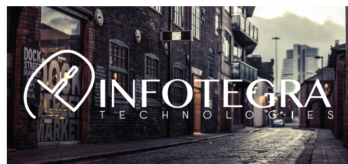
Fondo fotográfico oscuro